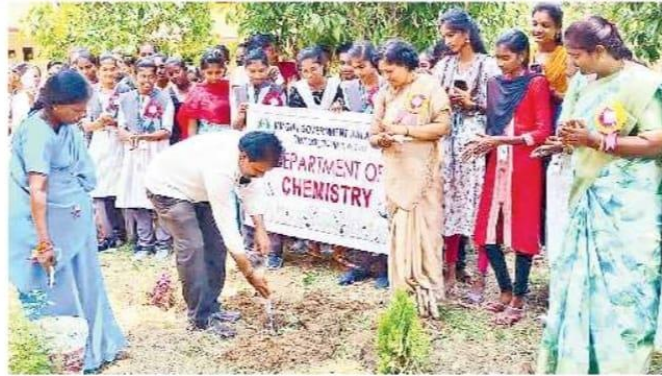
ఆకివీడు: మొక్క నాటుతున్న అధ్యాపకుడు